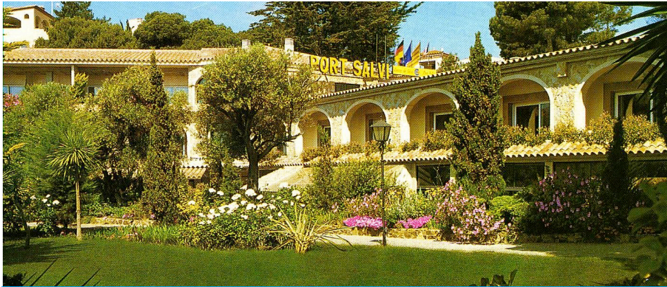
Le Centre de Santé "PORT SALVI"